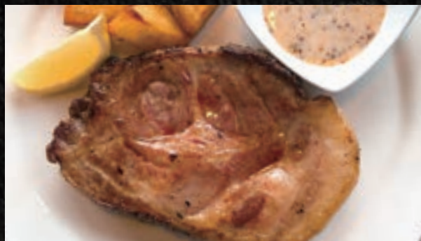
AGU ROAST PORK アグー豚ローストポーク