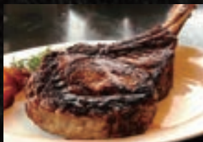
TOMAHAWK STEAK トマホーク ステーキ