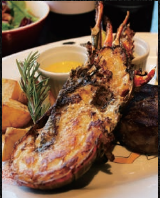
LOBSTER COMBO ロブスター コンボ

11. HALF LOBSTER ¥3,900 ロブスター (半身) ¥4,290 (税込)