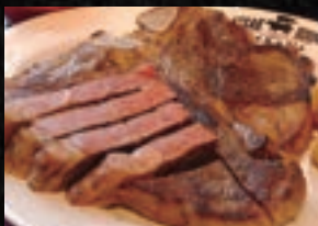
PORTER HOUSE STEAK ポーターハウスのステーキ