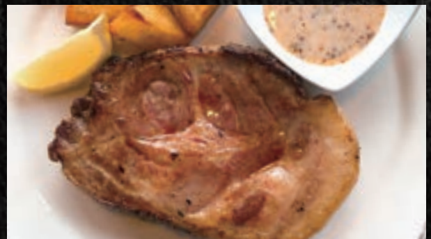
AGU ROAST PORK アグー豚ローストポーク