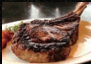
TOMAHAWK STEAK トマホーク ステーキ