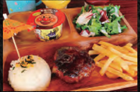
KIDS PLATE お子様プレート