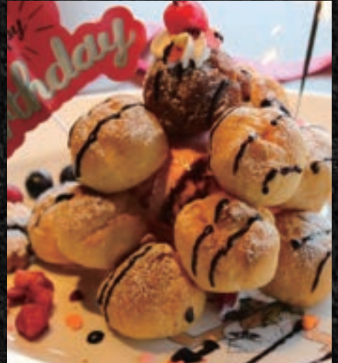
NAKAMA CREAM PUFF TOWER NAKAMA シュークリームタワー

*Image is illustration purposes ※写真はイメージになります。