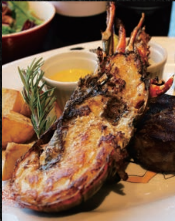
LOBSTER COMBO ロブスターコンボ

11. HALF LOBSTER ¥3,900 ロブスター (半身) ¥4,290 (税込)