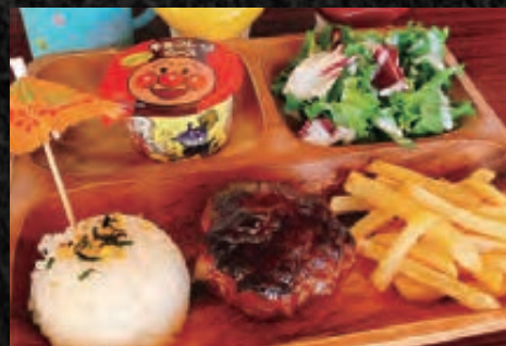
KIDS PLATE お子様プレート