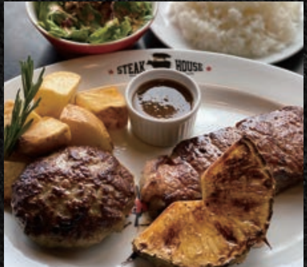
HAMBURG COMBO ハンバーグコンボ