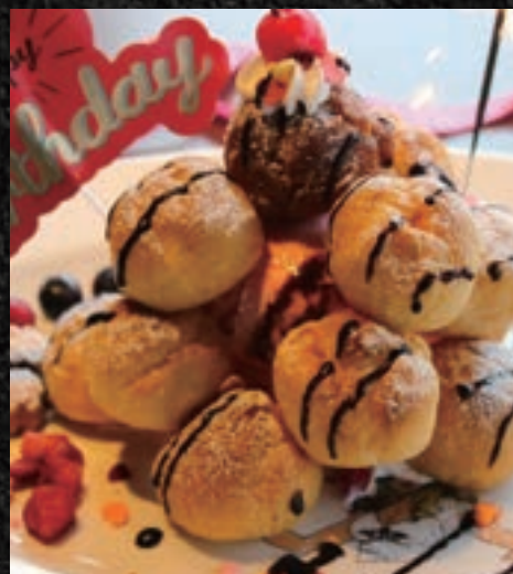
NAKAMA CREAM PUFF TOWER NAKAMA シュークリームタワー

*Image is illustration purposes ※写真はイメージになります。