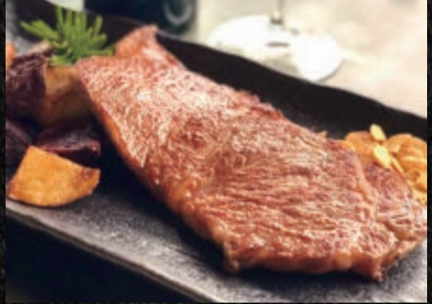
AGED WAGYU SIRLOIN STEAK 沖縄県産熟成サーロイン