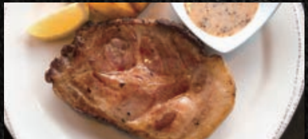
AGU ROAST PORK アグー豚ローストポーク